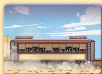
Wagon de queue

Placez la Voiture à voyager dans le temps devant la locomotive. Pour le reste, la mise en place se fait comme indiquée dans les règles du jeu.