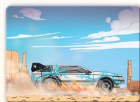
Voiture à voyager dans le temps